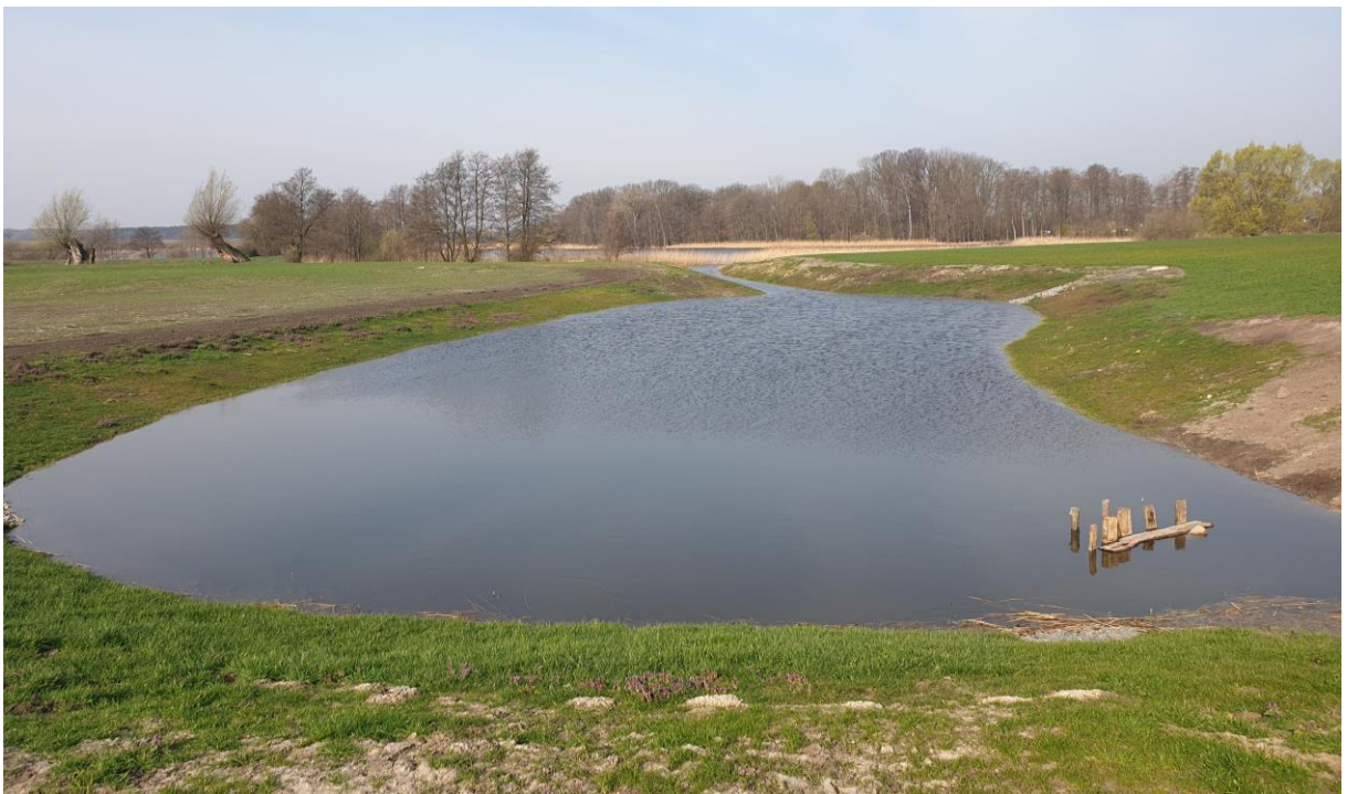
Abbildung 1: Naturnahes Kleingewässer mit Anschluss an den „Großen Stadtsee“, Blickrichtung Westen

Westlich des Geltungsbereiches besteht zum See eine Hangkante mit Reliefenergieunterschieden von bis zu fünf Metern.