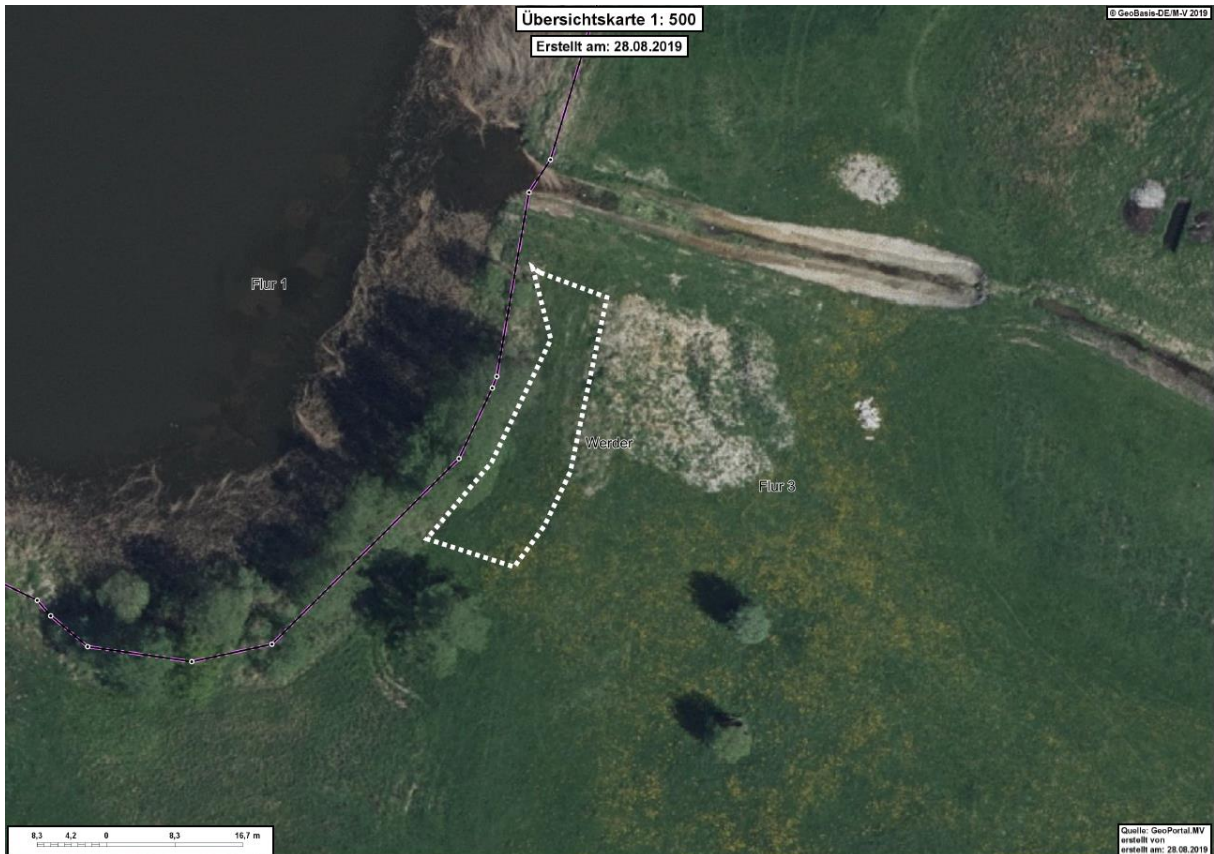
Abbildung 3: Darstellung der Ausgleichmaßnahme

Der oben bilanzierte Eingriff wird durch die Erweiterung des vorhandenen Schilfgürtels unmittelbar südlich des Geltungsbereiches kompensiert. Durch Entnahme von Oberboden erfolgt die Schaffung einer Flachwasserzone in einem Umfang von 248 m 2 . Der vorhandene Schilfgürtel wird sich in diesem Bereich ausbreiten und der Eingriff damit vollständig ausgeglichen.