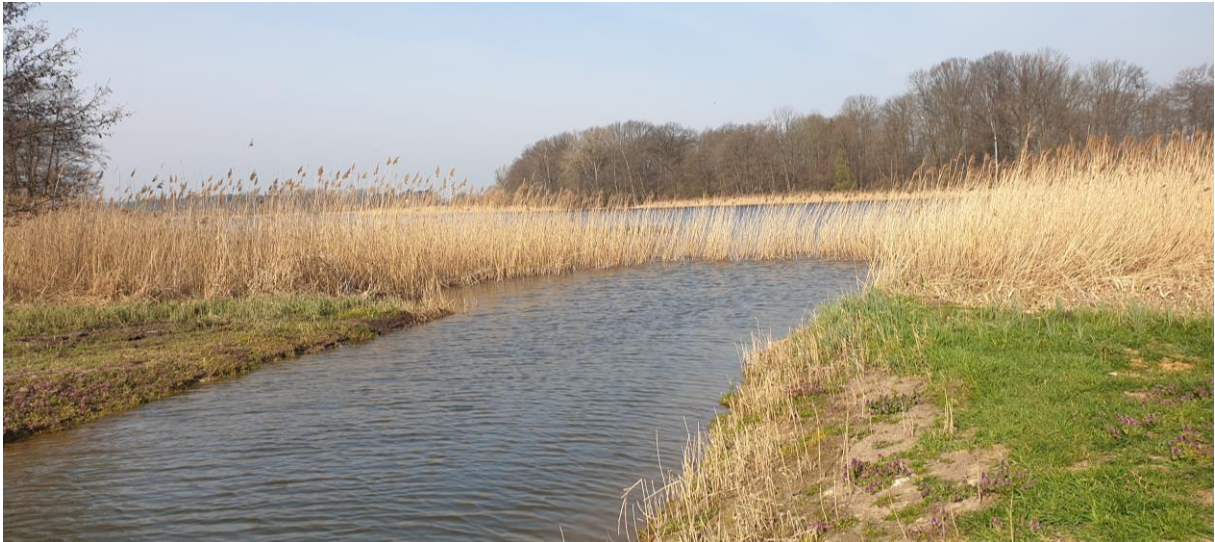
Abbildung 2: Bereich der Mündung in den „Großen Stadtsee“ (Quelle: Baukonzept Neubrandenburg GmbH, April 2019)

Der im Geltungsbereich vorhandene und verrohrte Vorfluter wurde in das Gewässer integriert. Dazu wurde die Verrohrung im betroffenen Gewässerabschnitt vollständig zurückgebaut und eine Verbindung zum „Großen Stadtsee“ geschaffen. Damit fungiert das Kleingewässer gleichzeitig auch als Puffer für die angeschlossene Vorflut. Im Bereich der Mündung ist nun in einem Umfang von 110 m 2 eine offene Wasserfläche vorzufinden.