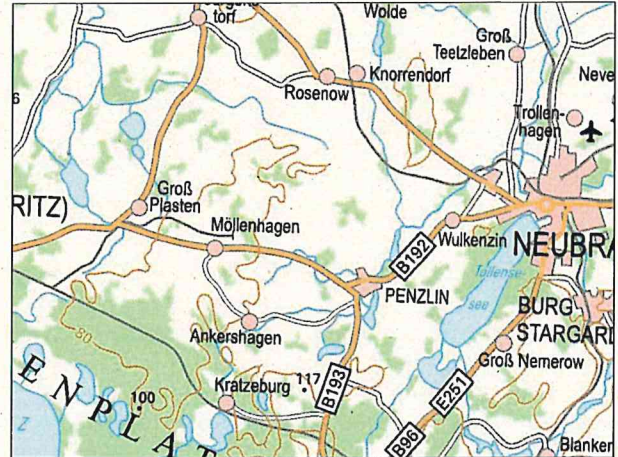
Kartenmaterial: © GeoBasis-DE/MV 2022; © Landesamt für Umwelt, Naturschutz und Geologie Mecklenburg-Vorpommern