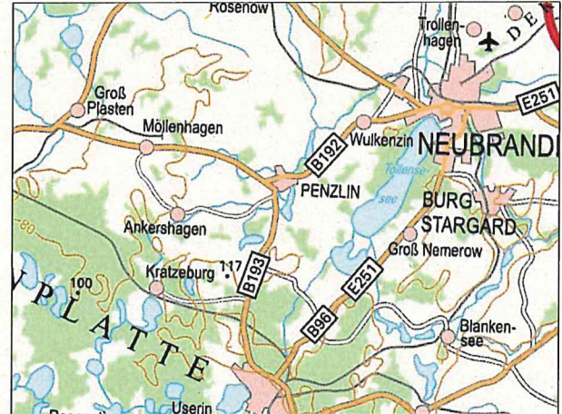
Kartenmaterial: © GeoBasis-DE/MV 2022; © Landesamt für Umwelt, Naturschutz und Geologie Mecklenburg-Vorpommern