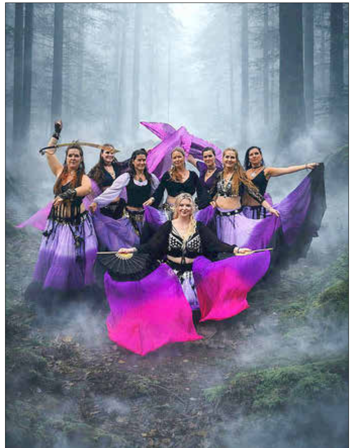
Asuna Bellydance Company