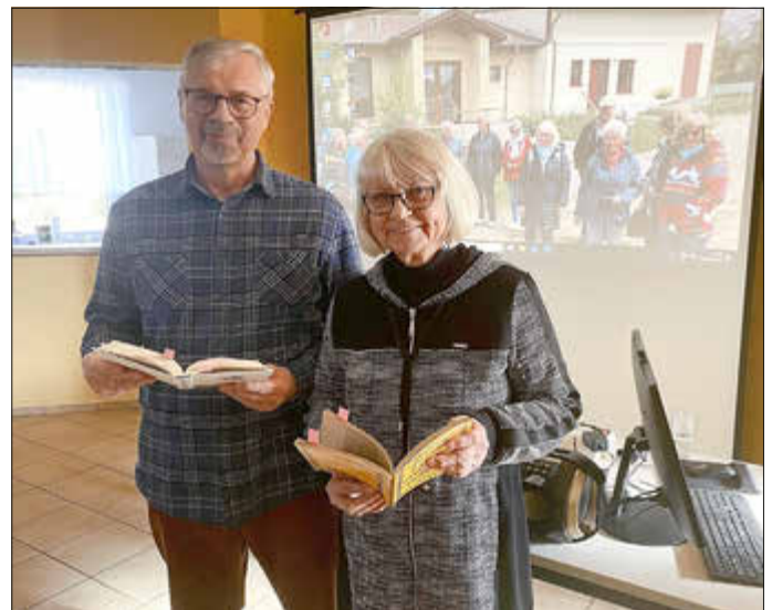
Ehepaar Nikolaus erfreute uns auf Plattdeutsch

Die 33 Mitglieder der Seniorengruppe Mallin/Passentin treffen sich seit einem Jahr allmonatlich zu interessanten Veranstaltungen. So verabschiedeten sie das vergangene Jahr mit einer zünftigen Weihnachtsfeier. Vor dem Probieren des Selbstgebackenen gab es per digitaler Fotoschau einen Spaziergang über verschiedene Weihnachtsmärkte.