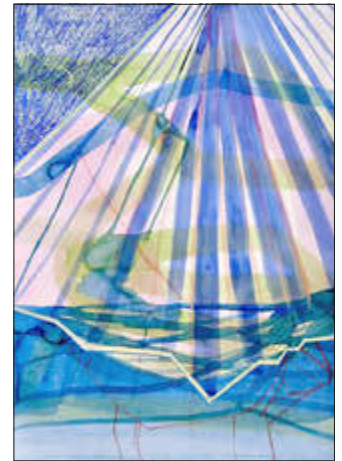
„Schirm“, 50 x 70 cm, Schellacktusche und Ölkreide auf Papier, 2026

In den Fluren der Stadtverwaltung kann seit Ende April eine neue Ausstellung betrachtet werden. Die Malerin und Grafikerin Linda Perthen stellt eine Auswahl ihrer Werke aus. Die insgesamt 20 Bilder, vorwiegend neue Arbeiten, können bis Mitte Juli während der Öffnungszeiten der Verwaltung angesehen werden. Die Bilder können auf Nachfrage auch käuflich erworben werden.